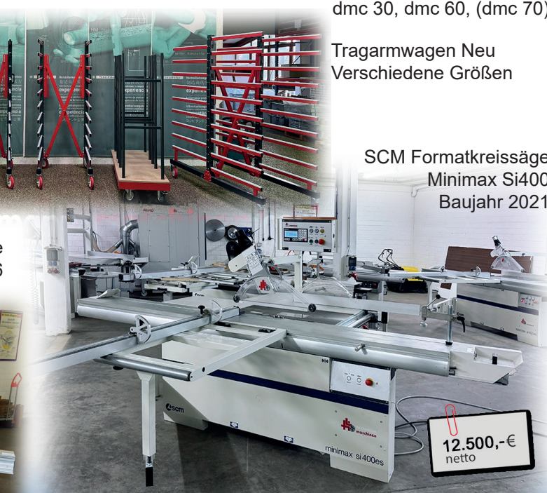
SCM Formatkreissäge Minimax Si400 Baujahr 2021