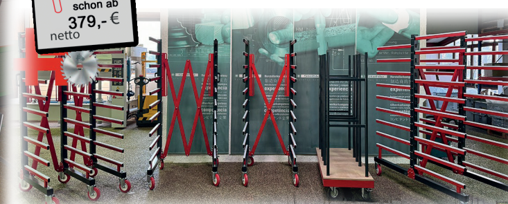
Tragarmwagen Neu Verschiedene Größen